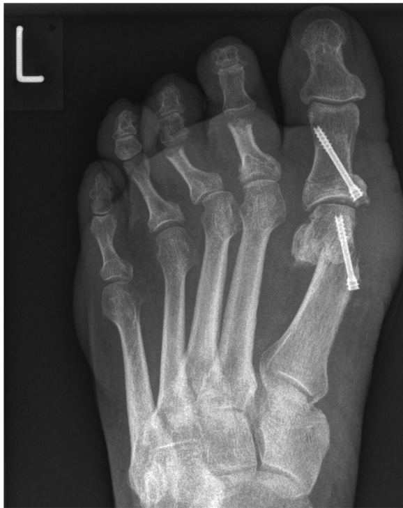
Röntgenbild nach Operation (anderer Patient)

Während frühere Operationsverfahren vor allem darauf ausgerichtet waren, die krumme Großzehe wieder zu begradigen und den störenden Ballen „wegzuschneiden“, versucht man heute meist das Gelenk zu erhalten und die natürlichen Verhältnisse soweit wie möglich wieder herzustellen.