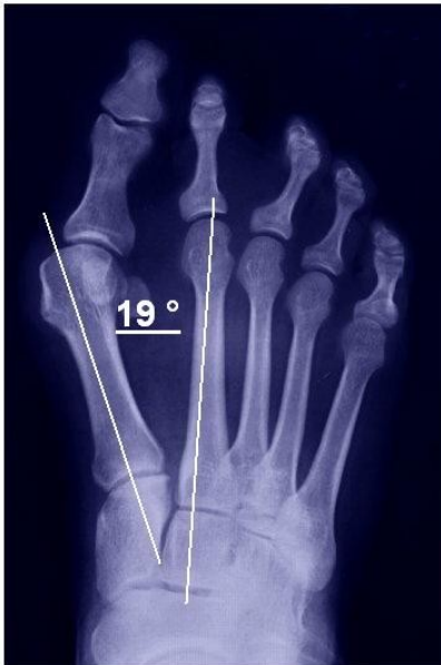
Das Röntgenbild eines klassischen Hallux valgus

Allgemein gilt, dass die Operation des Hallux valgus individuell geplant werden muss. Uns stehen mittlerweile viele gute Operationsverfahren zur Verfügung, so dass der Patient das recht auf eine speziell für ihn zugeschnittene Operationsmethode hat.