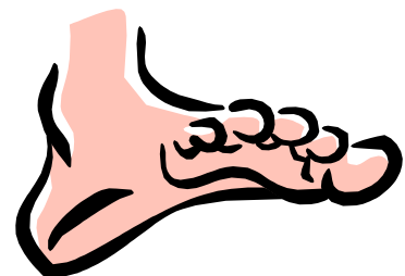
Fußquer- und Fußlängsgewölbe

An der Fußinnenseite wölbt sich nun das Mittelfußköpfchen nach außen, was dazu führt, dass die Schuhe am Ballen drücken. Die konservative Therapie besteht vor allem in der Empfehlung von Einlagen, die das zusammengebrochene Fußgerüst stützen. Dies ist aber eigentlich nur eine Erhaltung des vorhandenen Befundes. Oft tritt ja nach der kosmetisch störenden Fehlstellung dann zunehmend auch durch die Fehlstellung ein schneller Gelenkverschleiß, verbunden mit Schmerzen bei Belastung auf. Zudem finden sich zunehmend schmerzhaft Druckstellen und Hühneraugen im notwendigen Schuhwerk. Des weiteren bilden sich oft reaktiv Beuge-Fehlstellungen in den Zehengelenken 2-4, die als so genannte Krallen- oder Hammerzehen auch so fest werden können, dass sie willentlich oder auch unter leichtem Druck nicht mehr gestreckt werden können. Wir raten mittlerweile früher zur Operation, da sich dann die Fehlstellungen im Regelfall noch gut wieder rückführen lassen. Umso weiter die Fehlstellung und die Arthrose (Verschleiß des Gelenkes) fortgeschritten ist, umso schwieriger ist eine normale Funktion wieder herzustellen.